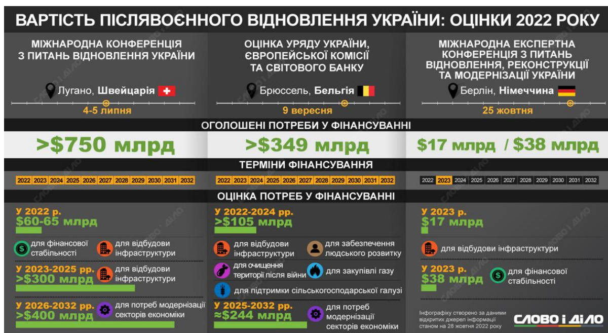
Рис. 1. Оцінка вартості відбудови спільно з міжнародними партнерами (фото екрану за посиланням [9])

З метою дослідження пошуку інноваційних рішень механізму фінансування повоєнного відновлення системи охорони здоров'я та, як наслідок, формування системи охорони здоров'я із новими властивостями, пропонуємо таке: визначити ключові напрями; обґрунтувати пріоритетні джерела фінансування; розробити актуальні підходи до використання фінансових ресурсів. В цілому ми маємо отримати нову систему фінансового забезпечення реалізації медичних послуг, що характеризуватиме діяльність закладів охорони здоров'я з позиції безпечності, адаптивності та стійкості. Наше бачення структури фінансового механізму повоєнного відновлення системи охорони здоров'я викладено на рисунку 2. Разом з тим, говорячи про фінансове забезпечення повоєнного відновлення та подальшого розвитку системи охорони здоров'я, необхідно, насамперед, визначитися із такими основними складовими, як джерела, інструменти та напрями використання фінансових ресурсів. Вони будуть мати різні форми та зміст як для цілей повоєнного відновлення, так і для подальшого розвитку системи охорони здоров'я.