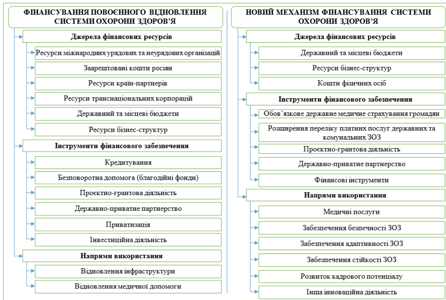
Рис. 2. Структура фінансового механізму повоєнного відновлення системи охорони здоров'я