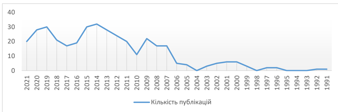
Рис. 1. Динаміка використання поняття «міська економічна політика» у міжнародній наукометричній базі даних Scopus [4]

Активно досліджувати це питання почали після 2007 року.